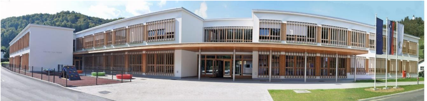
Slika 1: Osnovna šola Tržišče

Vsaka šola mora imeti izdelan Načrt varnih šolskih poti , s katerim učitelji seznanimo starše in otroke ob začetku šolskega leta ter jih opozorijo na najpogostejša nepravilna vedenja in nevarnosti na šolskih poteh. Načrt varnih šolskih poti vsebuje opis posameznega nevarnega mesta ter ustrezno ravnanje otrok in ostalih udeležencev v prometu. Načrt varnih šolskih poti mora viseti na vidnem mestu na šoli.