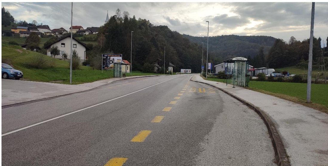
Slika 7: Prehod čez cesto na regionalni cesti Sevnica - Trebnje pri postajališču Mostec