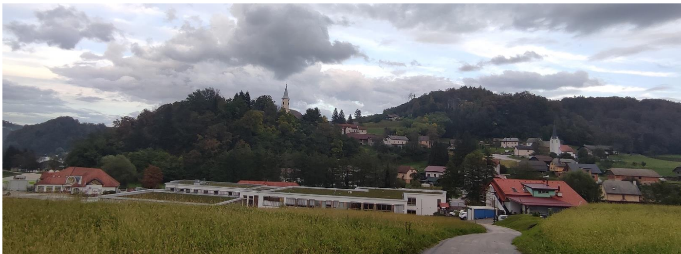
Slika 3: Vas Tržišče

Tržišče je gručasta vas v pobočni legi nad vzhodom v zoženi del Mirenske doline ob strmim in ovinkastem klancu ceste Malkovec - Slančji vrh. Pod njo na severni strani v dolini ob cesti Trebnje - Sevnica leži zaselek Mostec, kjer se odcepi cesta na železniško postajo in v Krmelj.