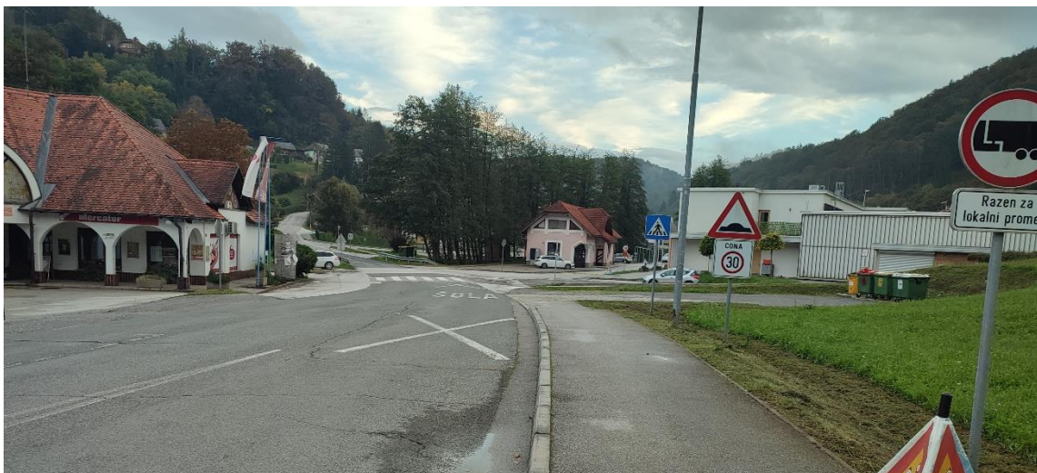
Slika 5: Križišče ob šoli

Vsi učenci, ki se pripeljejo z avtobusom iz smeri Drušče, Telče, Zg. Vodale, Jeperjek, Slančji Vrh, Krsinji Vrh, Malkovec, Pavla vas, Škovec, izstopijo iz prevoznega sredstva na avtobusnem obračališču pri igrišču. Tudi učenci, ki se pripeljejo iz Gabrja, Spodnjih Vodal, Vrhka, Polja, Pijavic in Skrovnika izstopijo na obračališču. Ko zapustijo prevozno sredstvo, peš odidejo do šolske stavbe. Prečkajo most preko potoka in lokalno cesto preko zaznamovanega prehoda za pešce.