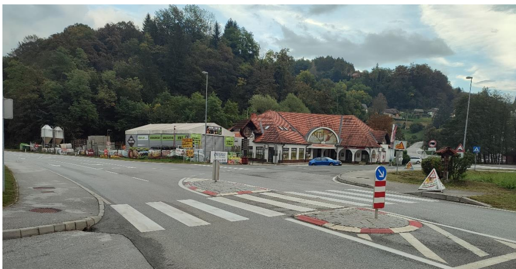
Slika 8: Prehod čez cesto v križišču proti šoli