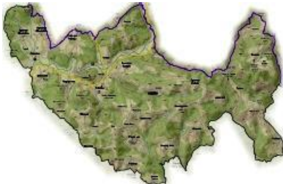
Slika 2: Šolski okoliš

Osnovna šola Tržišče zajema naslednje vasi: Drušče, Gabrje, Jeperjek, Kaplja vas, Križ, Krsinji Vrh, Malkovec, Zgornje Mladetiče, Otavnik, Pavla vas, Pijavice, Polje, Slančji Vrh, Skrovnik, Škovec, Telče, Telčice, Trščina, Tržišče, Spodnje Vodale, Zgornje Vodale in Vrhek.