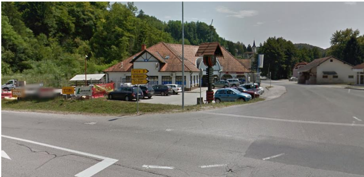
Slika 5: Križišče ob šoli