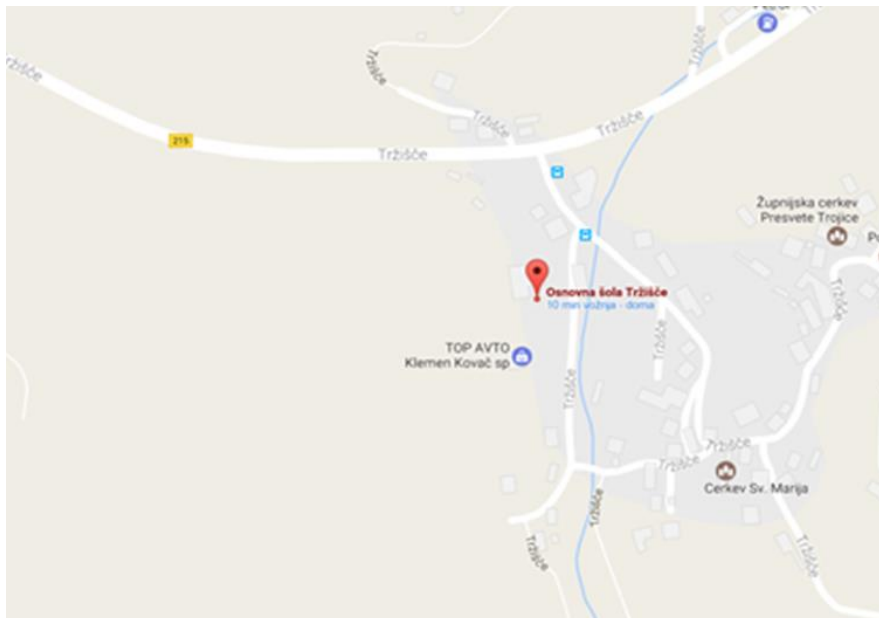
Slika 4:Lokacija šole

Zajemamo večji del šolskega okoliša, to pa pomeni, da so med učenci kilometrske razdalje. Trenutno hodi v šolo peš le manjše število otrok iz bližnje okolice šole. Vsi ostali pa se vozijo z organiziranimi šolskimi prevozi, in sicer z dvema avtobusoma .