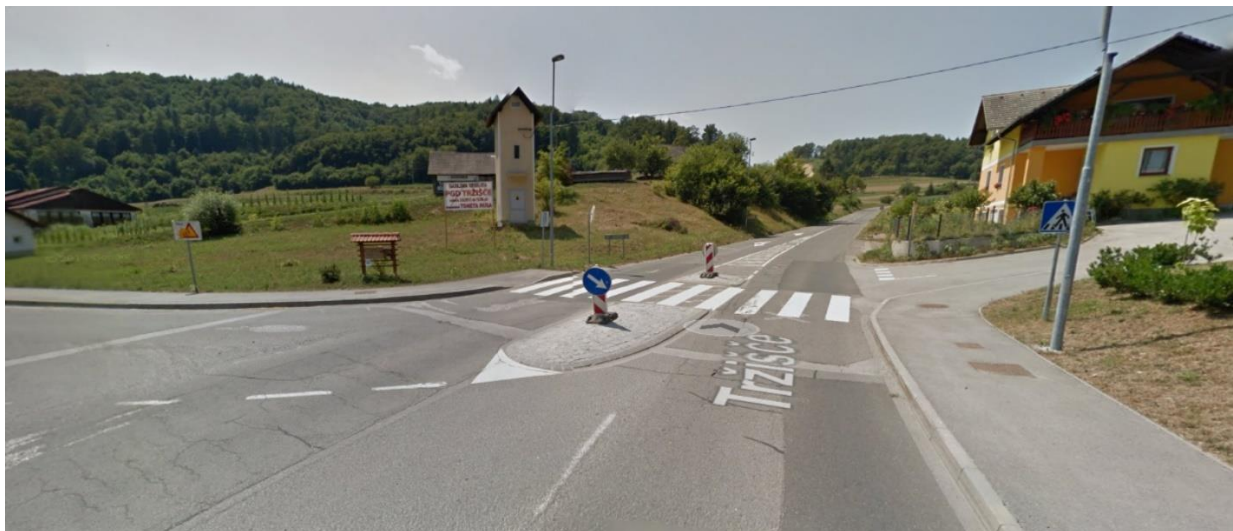
Slika 8: Prehod čez cesto v križišču proti šoli