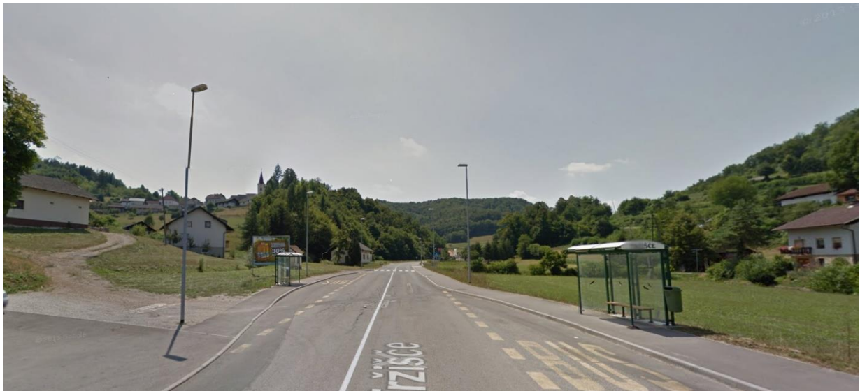
Slika 7: Prehod čez cesto na regionalni cesti Sevnica - Trebnje pri postajališču :