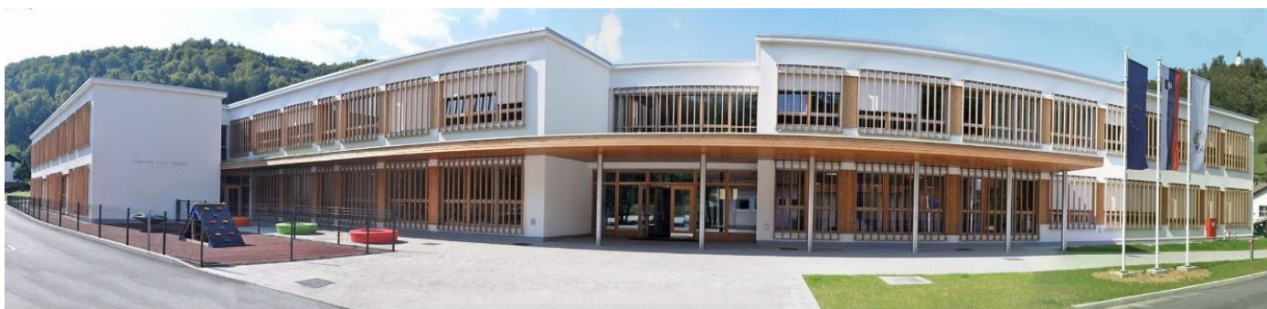
Slika 1: Osnovna šola Tržišče

Vsaka šola mora imeti izdelan Načrt varnih šolskih poti , s katerim učitelji seznanimo starše in otroke ob začetku šolskega leta ter jih opozorijo na najpogostejša nepravilna vedenja in nevarnosti na šolskih poteh. Načrt varnih šolskih poti vsebuje opis posameznega nevarnega mesta ter ustrezno ravnanje otrok in ostalih udeležencev v prometu. Načrt varnih šolskih poti mora viseti na vidnem mestu na šoli.