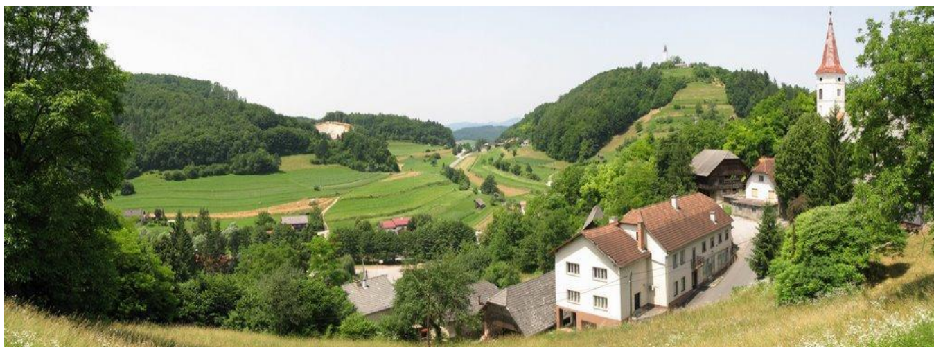
Slika 3: Vas Tržišče

Tržišče je gručasta vas v pobočni legi nad vzhodom v zoženi del Mirenske doline ob strmim in ovinkastem klancu ceste Malkovec - Slančji vrh. Pod njo na severni strani v dolini ob cesti Trebnje - Sevnica leži zaselek Mostec, kjer se odcepi cesta na železniško postajo in v Krmelj.